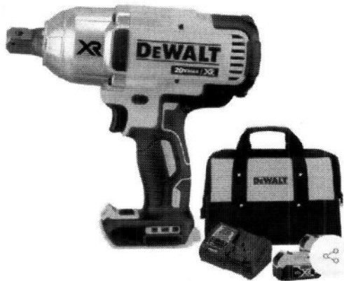
Item 20 – CHAVE DE IMPACTO PNEUMÁTICA INDUSTRIAL CAMINHÃO/ÔNIBUS 420KG