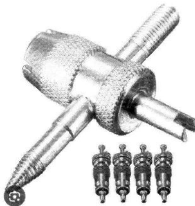
Item 69 – SACA VÁLVULA COMPRIDO DE BICO DE RODA