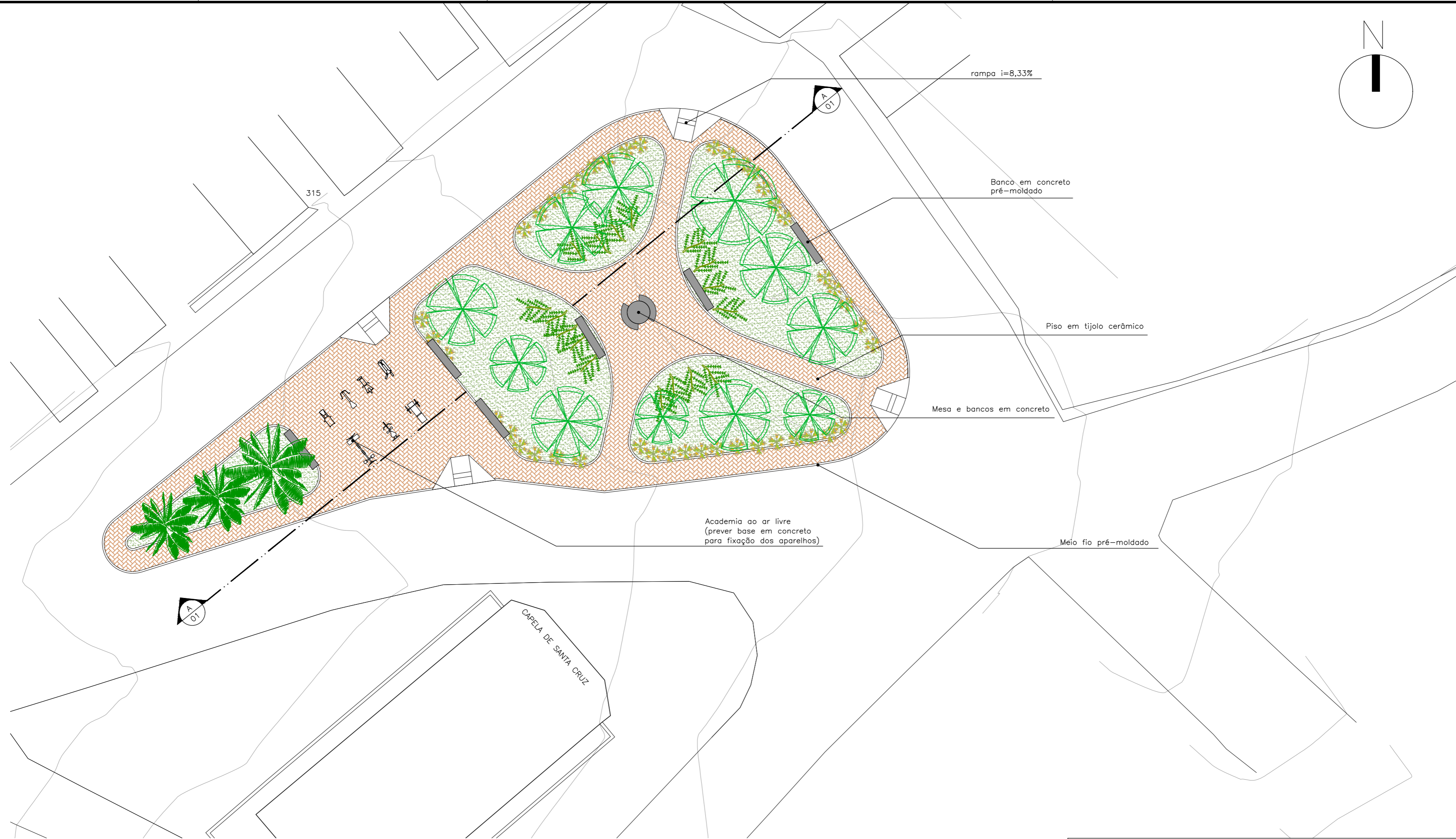
PLANTA – BAIXA HUMANIZADA ESCALA : 1/200