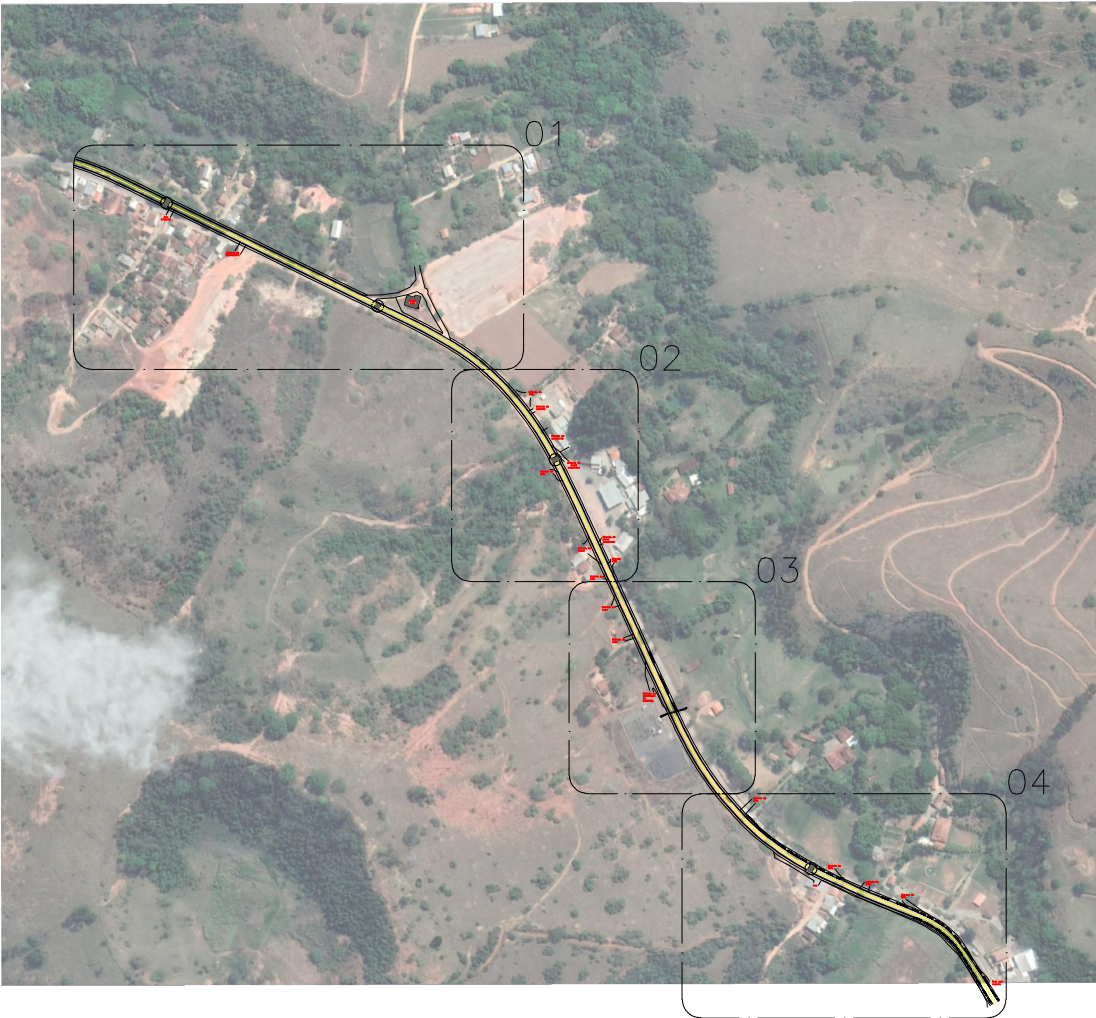
ÁREA DE INTERVENÇÃO SEM ESCALA